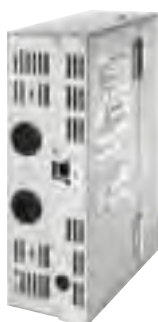
(wys. x szer. x głęb.): 248 x 185 x 80 mm Zasilanie AC 100 do 240 V (50/60 Hz), 17 W (oddzielne)